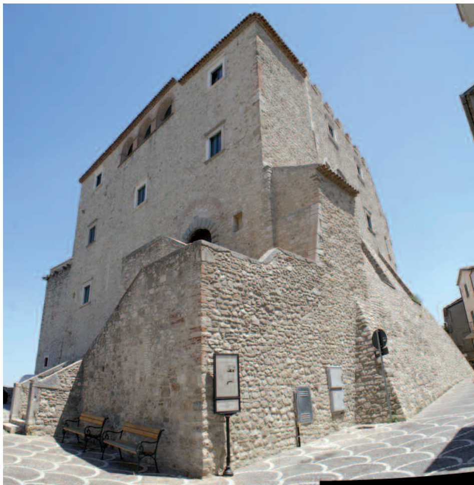
Castello Di Capua