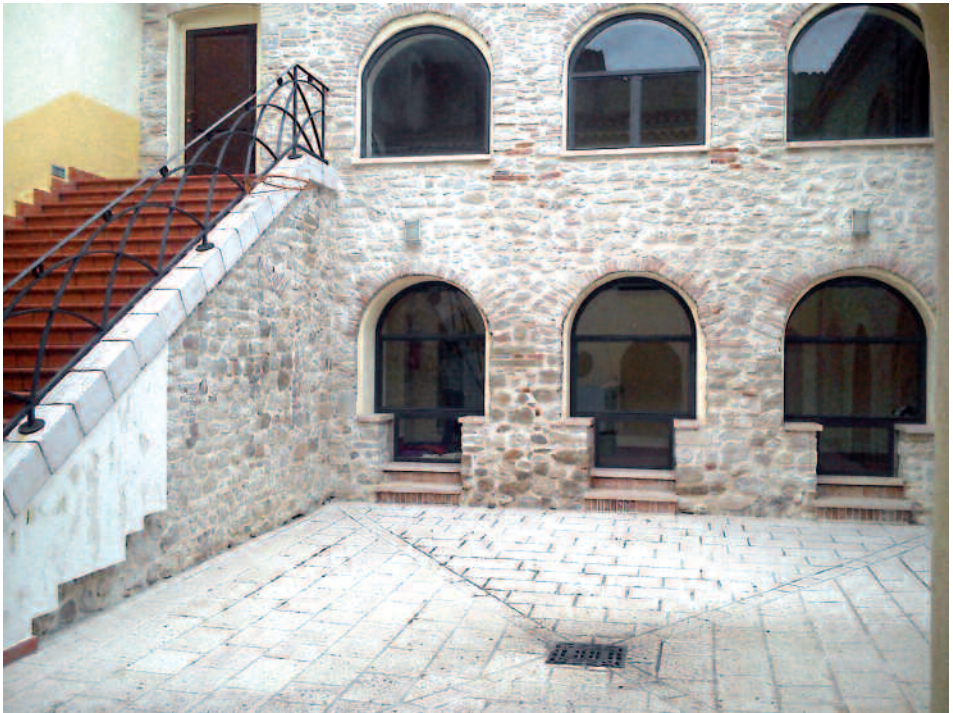
Chiostro del Convento di S. Nicola Gambatesa